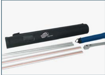
Leisten mit Panel, Stange, Fuß und Tasche.

Das Bannersystem in verschiedenen Breiten, einfach und schnell aufgebaut.