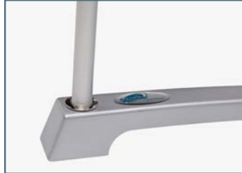
Fuß mit Stange eingeschoben.