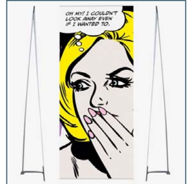
Sehr gute Paneelspannung