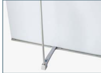
Ansicht von hinten.