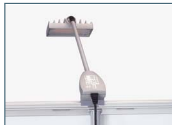
Aufsteckbare LED Leuchte